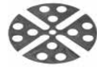
U-E10 (T- 1mm) U-E20 (T- 2mm)