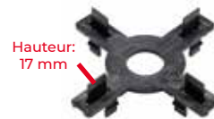
Epaisseur: 2, 3 et 4,5mm